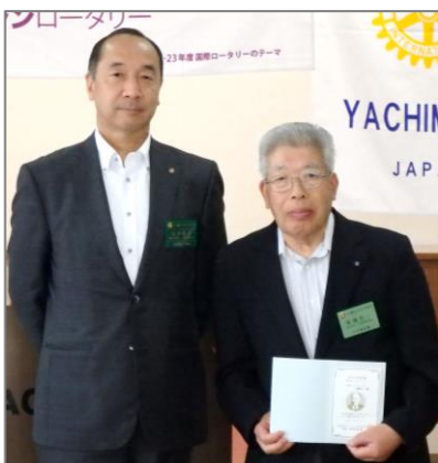
米山功労者 第11回 (メジャードナー)