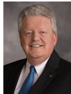
2019-20年度 国際ロータリー会長 マーク・ダニエル・マローニー Decatur RC(アラバマ州)

例会場 八街商工会議所 3階 大ホール 毎週水曜日 12:30~13:30 電話 043 - 443 - 3021 FAX 043 - 443 - 7221 創立 1966年(昭和41年)5月22日