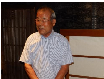
檜木会員の一本絞め