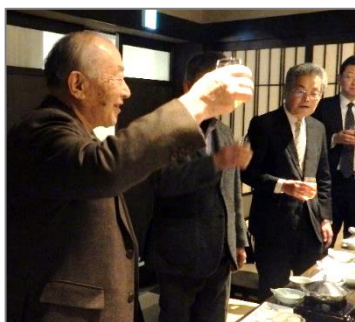
樋渡会員 乾杯の挨拶