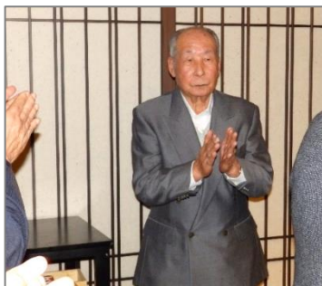
小川会員 三本締め