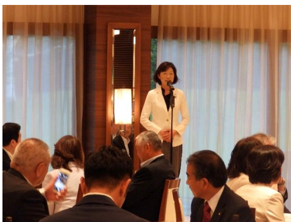
漆原ガバナーノミニーご挨拶