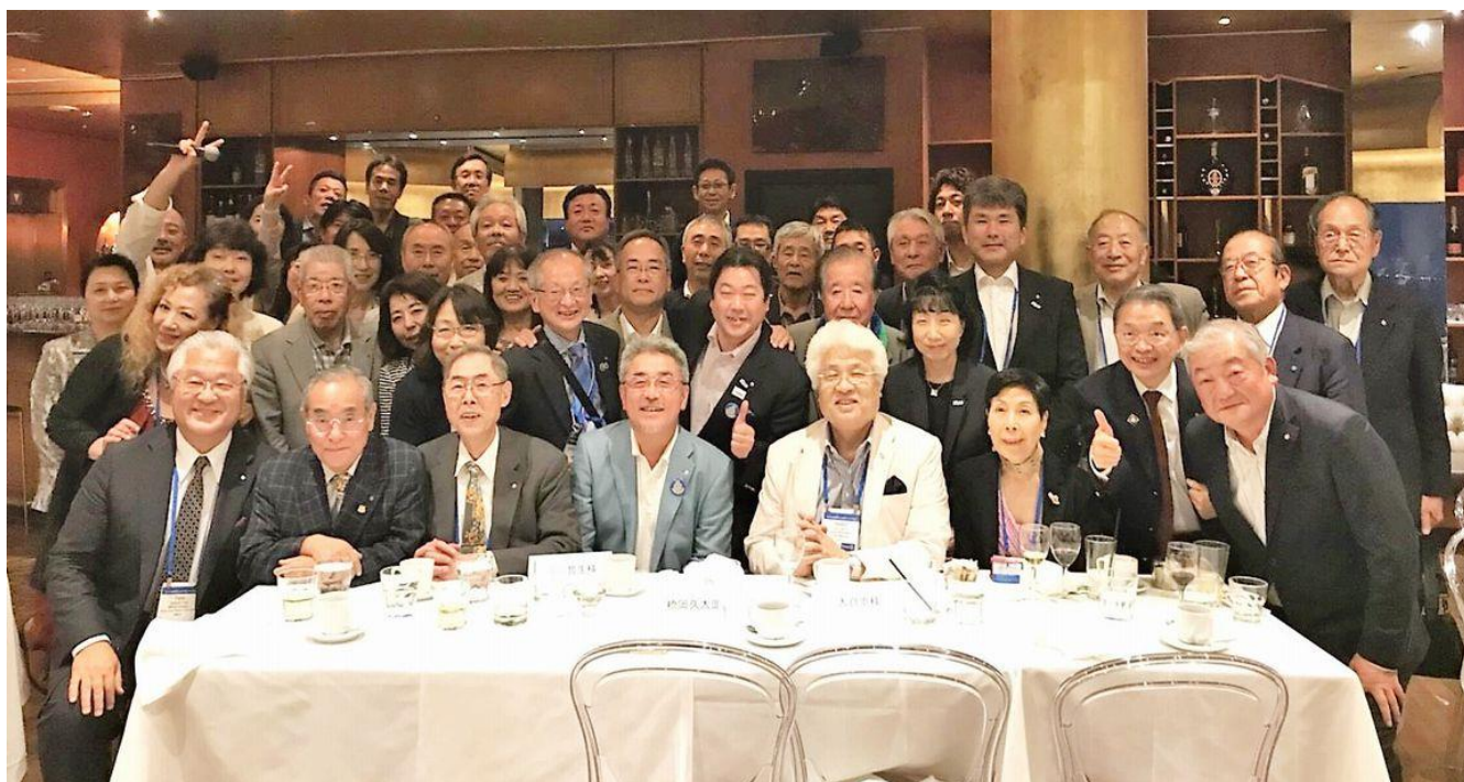
トロント国際大会千葉ナイト ウェスティンハーバーキャッスルホテル38階 (6/24)