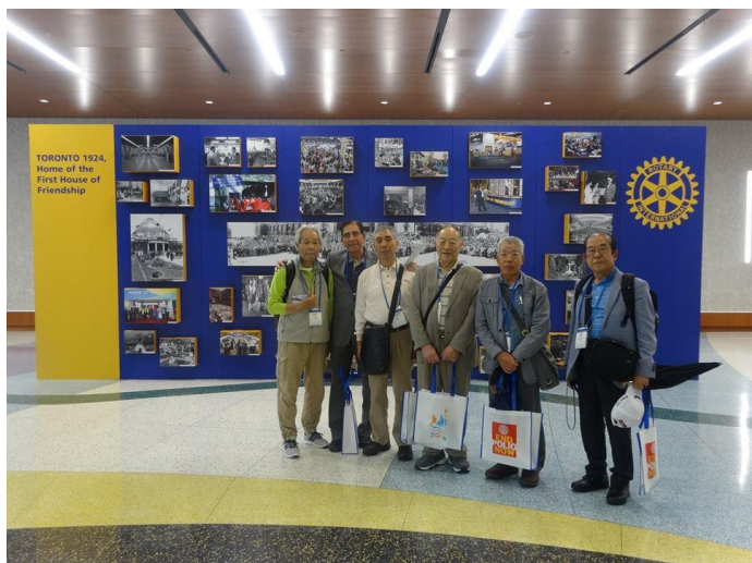
トロント国際大会メトロントコンベンションセンターで (6/23)