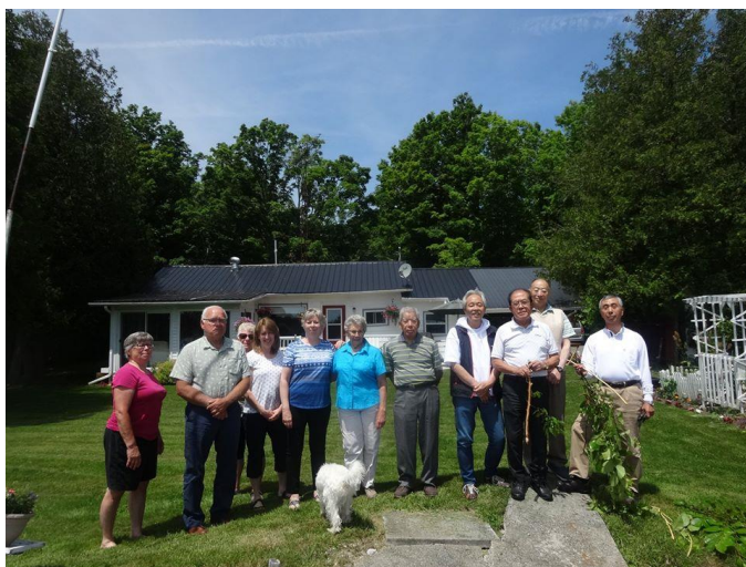
オンタリオ州ライムレイク湖畔のコテージを訪問 (6/26)