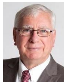
2017-18年度 国際ロータリー会長 アン・H.S.ライズリー サントリンガムARC 豪州

例会場 八街商工会議所 3階 大ホール 毎週水曜日 12:30～13:30 電話 043 - 443 - 3021 FAX 043 - 443 - 7221 創立 1966年(昭和41年)5月22日